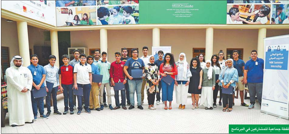
لقطة جماعية للمشاركين في البرنامج

الجولات الميدانية التي تهدف إلى إتاحة المجال أمامهم، لسفرهم على عمل إدارات بعض الفئات على الطلبة.